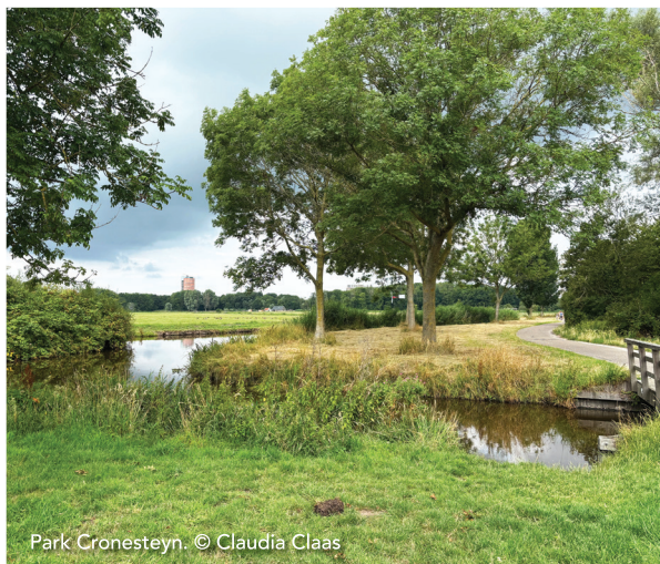
Park Cronesteyn.

Je fietst hier door fietsknooppuntbordjes te volgen, je gaat via de knooppunten 70, 64, 65 en 16 weer terug naar 70. Daar ga je rechtdoor en fietst circa vijfhonderd meter over het Leidse Zangfietspad. Je mag hier vrijuit zingen, als je dat wilt!