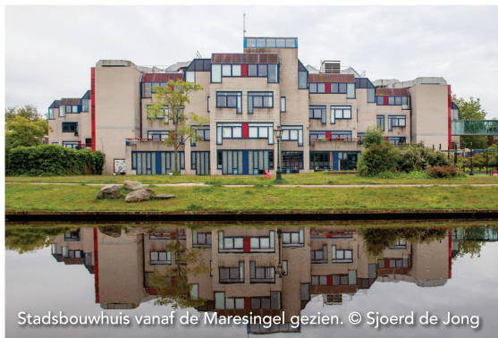
Stadsbouwhuis vanaf de Maresingel gezien.

Startpunt is het stadhuis, aan de Breestraat, ter hoogte van de stadhuis-trap. Met de rug naar het stadhuis ga je linksaf, de Breestraat uit. Op de zespriem ga je schuin links, Hogewoerd. Bij de stoplichten linksaf, Sint Jorissteeg, even verder wordt het Hooigracht. Deze helemaal uitrijden via de Klokpoot en aan het einde links de Langegracht op, na 150 meter aan de rechterhand het voormalige STADSBOUWHUIS (PAND 26) .